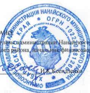
ГРАФИК перечисления Субсидии

Заместитель главы администрации Нанайского муниципального района, начальник финансового управления